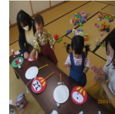
1月4日 お正月おもちゃ制作