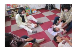
5月2日(火) ふれあいあそび