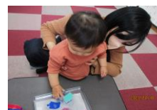
4月18日(火) こいのぼり制作